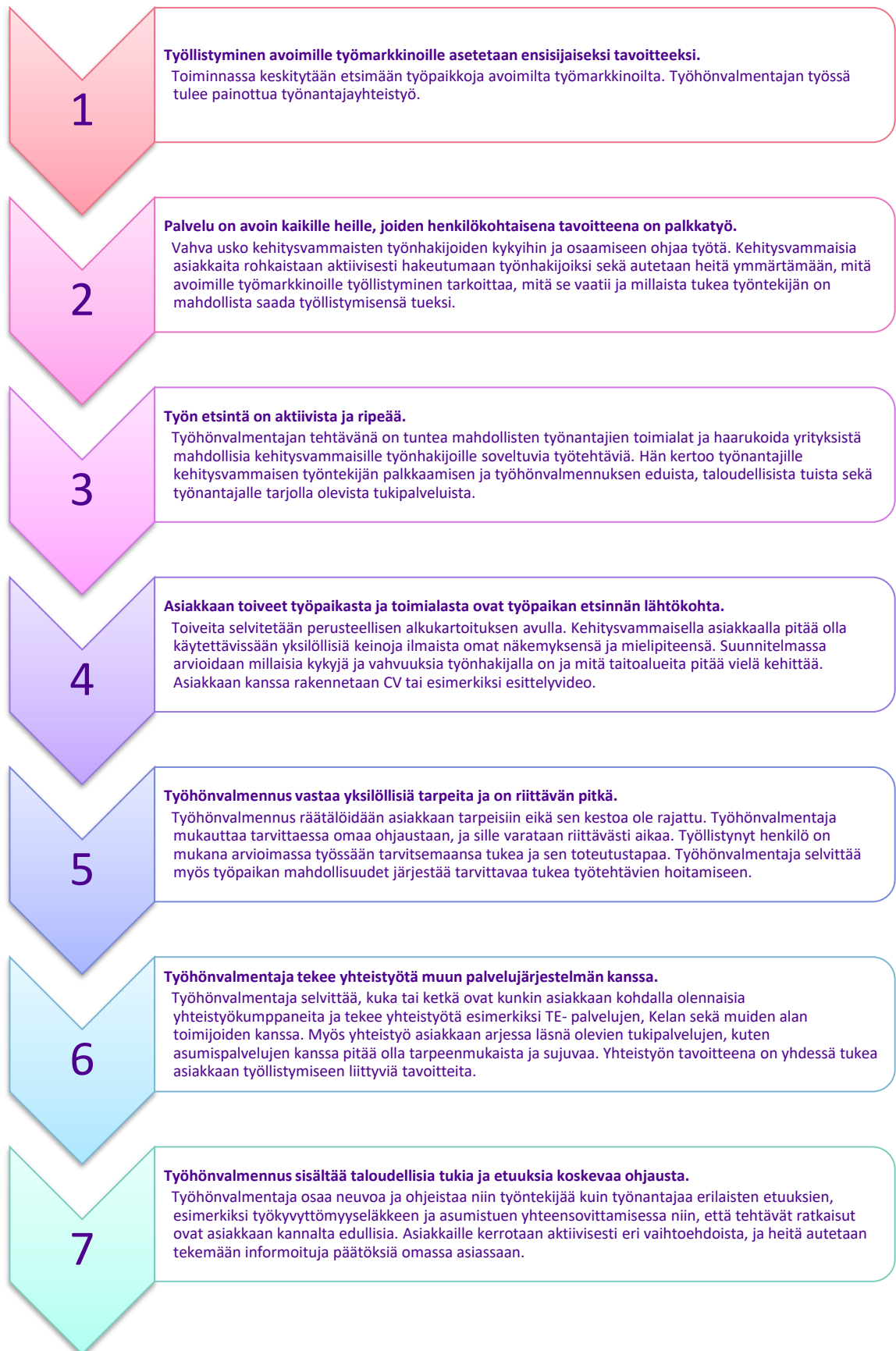
KUVIO 2. Tuloksellisen työhönvalmennuksen laatukselliset tiivistetyt kriteerit (Vernerin 2021.)