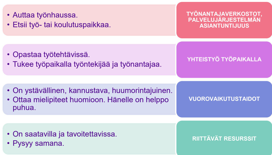
KUVIO 3. Työhönvalmentajan tuki työelämässä on vuorovaikutuksellista ja käytännönläheistä

Seuraavassa kuviossa esitetään kootusti aineistosta esille tulleet yläluokat työhönvalmennukseen ja työhönvalmentajaan liittyvistä kokemuksista.